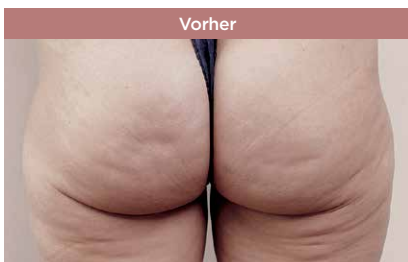
Die Ausgangssituation vor der Behandlung mit der Cellfina®-Methode.

Meine 11-jährige Tochter Angelina war ganz überrascht und meinte erstaunt: „Die Bucklige Welt ist weg!“